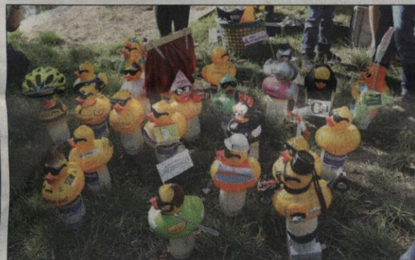
Die Firmen-Enten waren bunter, skurriler und größer als die normalen Enten. Dennoch gab es genau so viel Spaß!

kunst, Lasershow und Picknick“. Der Morgen stand ganz im Zeichen der Enten. Beim 13. Wolfenbütteler Entenrennen und 2. Firmen-Rennen gab es jede Menge Spannung und Spaß. Über 1000 Enten schippten auf der Oker und kämpften um die vorderen Plätze. Das alles können Sie auf den Sonderseiten auf den Seiten 29-32 dieser Ausgabe nachverfolgen. MS