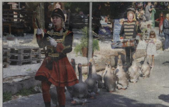
Die Gänsekapelle war sicherlich ein Highlight des Stadtgrabenfestes.